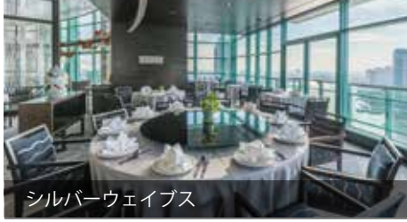
シルバーウェイブス

おいしいインターナショナル・アラカルトメニューの朝食、ランチ、ディナーと、作り立ての心躍る朝食ビュッフェとディナービュッフェ